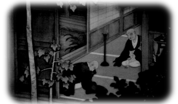
月窓筆 草庵之聖人 (三条別院蔵)